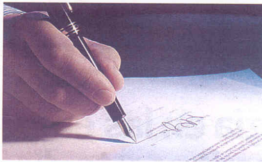
La prueba grafológica no debe realizarse con pluma. elEconomista

La dirección de cada línea de escritura revela las expectativas de la persona en su futuro puesto de trabajo y las personas que unen las letras en cada palabra suelen ser más consecuentes y capaces de hilvanar mejor las acciones. "Un comercial, por ejemplo, debe tener una letra